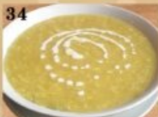
34 コーンクリームスープ 590円