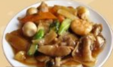
33 八宝菜 1050円