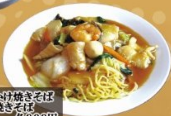
46 五目あんかけ焼きそば かた焼きそば 各900円