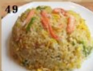
49 ずわい蟹とレタスの チャーハン 900円