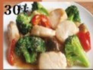
30 牡蠣とブロッコリーの 明太子炒め 1150円