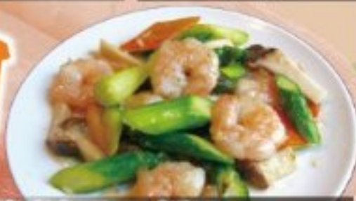
28 海老とアスパラの ガーリックバター炒め 1150円