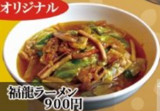
43 福龍ラーメン 900円