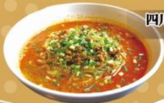
四川担々麺 42 800円