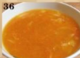
36 蟹入りふかひれスープ 980円