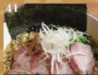
41 チャーシュー麺 800円