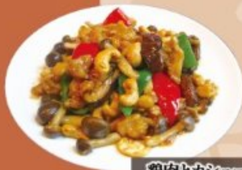
24 鶏肉とカシューナッツの オイスターソース炒め 850円