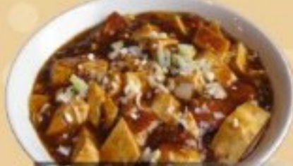
31 四川麻婆豆腐 680円