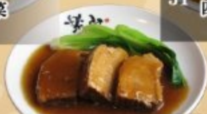
32 豚バラ肉の角煮 980円