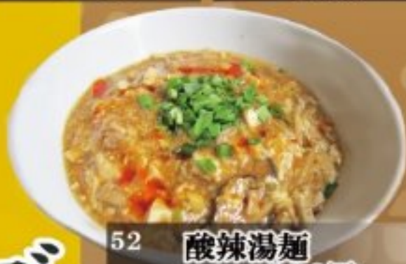
52 酸辣湯麺 830円