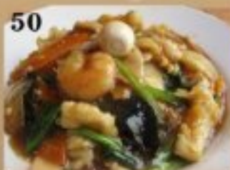
50 魚介と野菜の 中華丼 900円