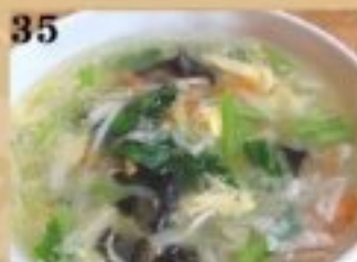
35 卵と野菜のスープ 590円