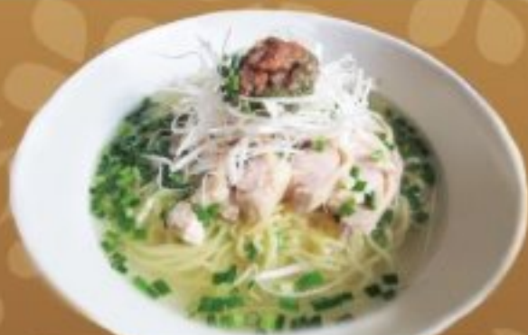
45 蒸し鶏のさっぱり 塩ラーメン 800円