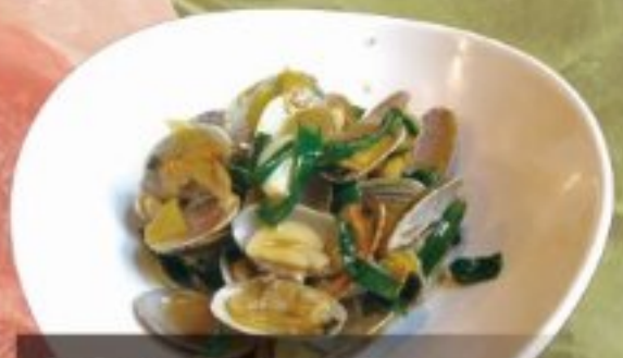
あさりの紹興酒蒸し 880円