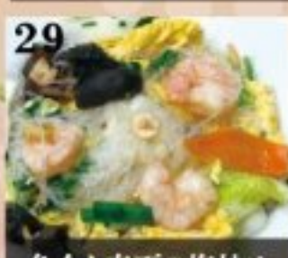
29 魚介と春雨の塩炒め 1050円