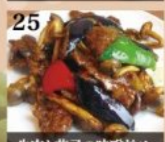
25 牛肉と茄子の味噌炒め 980円