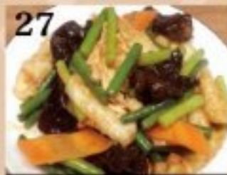
27 イカとニンニクの芽と卵の ピリ辛炒め 800円