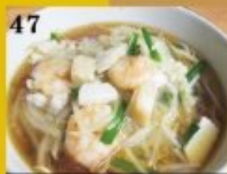
47 魚介もやし麺 900円