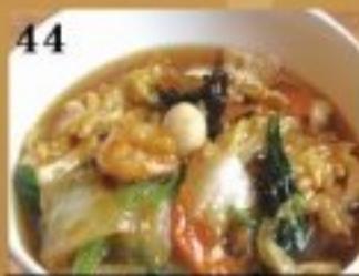
44 魚介と野菜のあんかけ ラーメン 900円