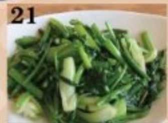
21 新鮮中国野菜の塩炒め 880円