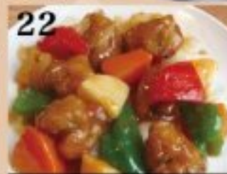
22 豚肩ロールの酢豚 950円