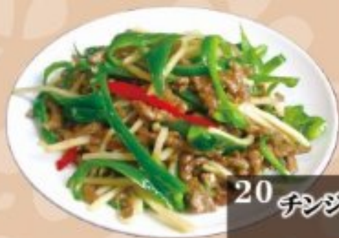
20 チンジャオロールス 980円